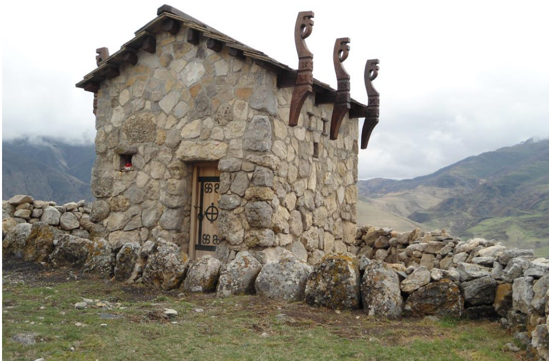
Рис. 3. Святилище Хуыцауы дзуар (Осетия)