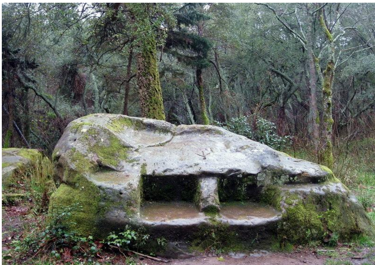
Рис. 1. Кудепстинский жертвенный камень

Одним из таких языческих капищ на территории Северо-западного Кавказа, а в частности территория города Сочи, является кудепстинский жертвенный камень.